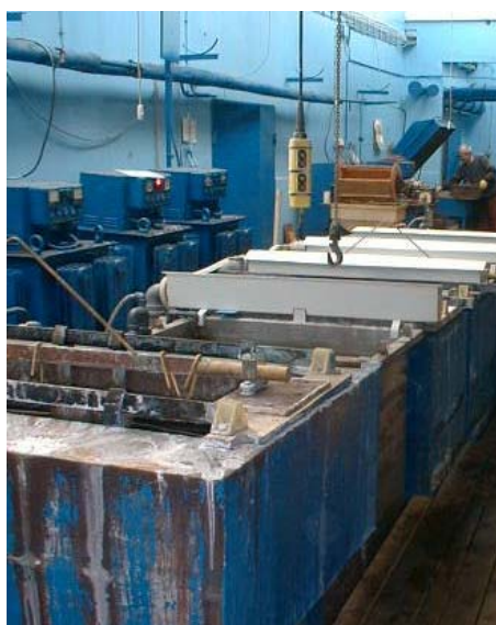
Skyllekar i galvanovirksomhed